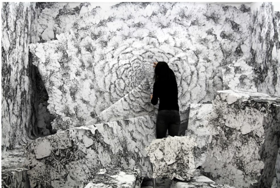
Cristal 1, 2018, Espace dart Lycée Valin, La Rochelle

A partir d'un dessin-matrice relié au contexte social et géographique du lieu, la démarche d'Anaïs Lelièvre procède d'un processus de propagation s'apparentant à une excroissance minérale. D'agrandissements en rétrécissements de l'image, elle multiplie, découpe et combine les fragments, développe un réseau de liens allant jusqu'à leur donner l'ampleur d'une installation in situ.